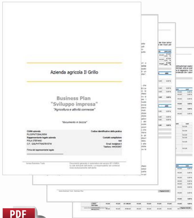
Table quantitative present in the final document: